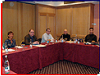
Quelques photos du congrès CI à Paris le 4 et 5 février 2006